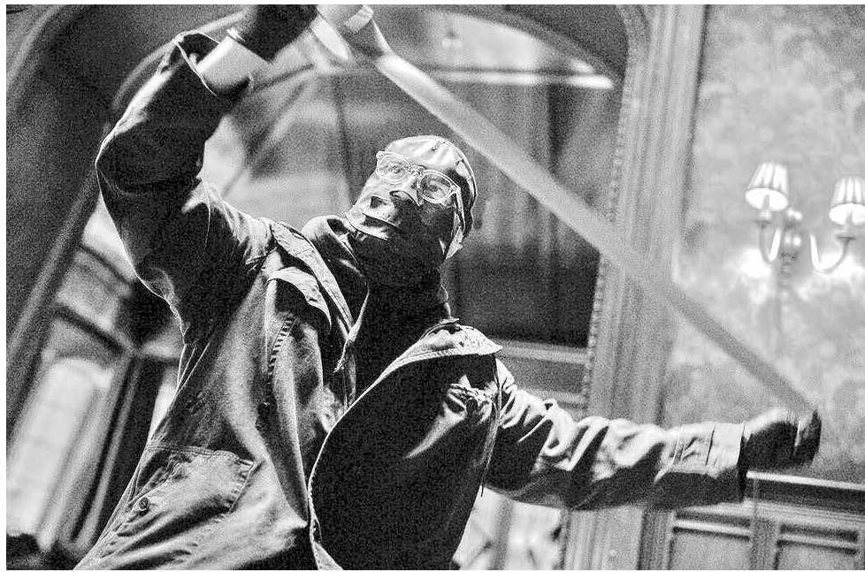
Nova versão cinematográfica do Charada (vivido por Paul Dano) em 'Batman' é mais sombria

enigmáticas coloca o Maior Detetive do Mundo em uma investigação sobre o submundo, onde ele encontra personagens como Selina Kyle, também conhecida como Mulher-Gato (Zoë Kravitz), Oswald Cobblepot, o Pinguim (Colin Farrell) e Edward Nashton, também conhecido como Charada (Paul Dano). Conforme as evidências começam a chegar mais perto de casa e a escala dos planos do perpetrador se torna clara, Batman deve forjar novos relacionamentos, desmascarar o culpado e fazer justiça ao abuso de poder e à corrupção que há muito tempo assola Gotham. CENTERPLEX MAG 3: 17h (dub.) - 20h30 (leg.) - 21h30 (leg.); CENTERPLEX MAG 4: 18h (dub.) - 21h30 (leg.); CINÉPOLIS MANAÍRA 2 (dub.): 14h15 - 17h45 - 21h15; CINÉPOLIS MANAÍRA 3: 13h45 (dub., exceto sáb.) - 17h15 (dub.) - 20h45 (leg.); CINÉPOLIS MANAÍRA 4 (leg.): 15h - 18h30 - 22h; CINÉPOLIS MANAÍRA 6 (dub.): 14h45 - 18h15 - 21h45; CINÉPOLIS MANAÍRA 7 (leg.): 14h - 17h30 - 21h; CINÉPOLIS MANAÍRA 10 - VIP (leg.): 14h30 - 18h - 21h30; CINÉPOLIS MANGABEIRA 1 (dub.): 15h - 18h30 - 22h; CINÉPOLIS MANGABEIRA 3: 13h30 (dub., exceto sáb., seg. e ter.) - 17h (dub., exceto seg. e ter.) - 20h30 (leg., exceto seg. e ter.); CINÉPOLIS MANGABEIRA 4 (dub.): 14h30 - 18h - 21h30; CINÉPOLIS MANGABEIRA 5 (dub.): 14h - 17h30 - 21h; CINE SERCLA TAMBIA 3 (dub.): 18h; CINE SERCLA TAMBIA 5 (dub.): 15h45 - 19h15; CINE SERCLA TAMBIA 6 (dub.): 16h30 - 20h; CINE SERCLA PARTAGE 1 (dub.): 15h45 - 19h15; CINE SERCLA PARTAGE 2