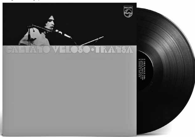
Realizado durante o exílio, 'Transa' é o primeiro de uma trilogia de LPs com arranjos experimentais – junto com 'Araçá Azul' (1973) e 'Joia' (1975)