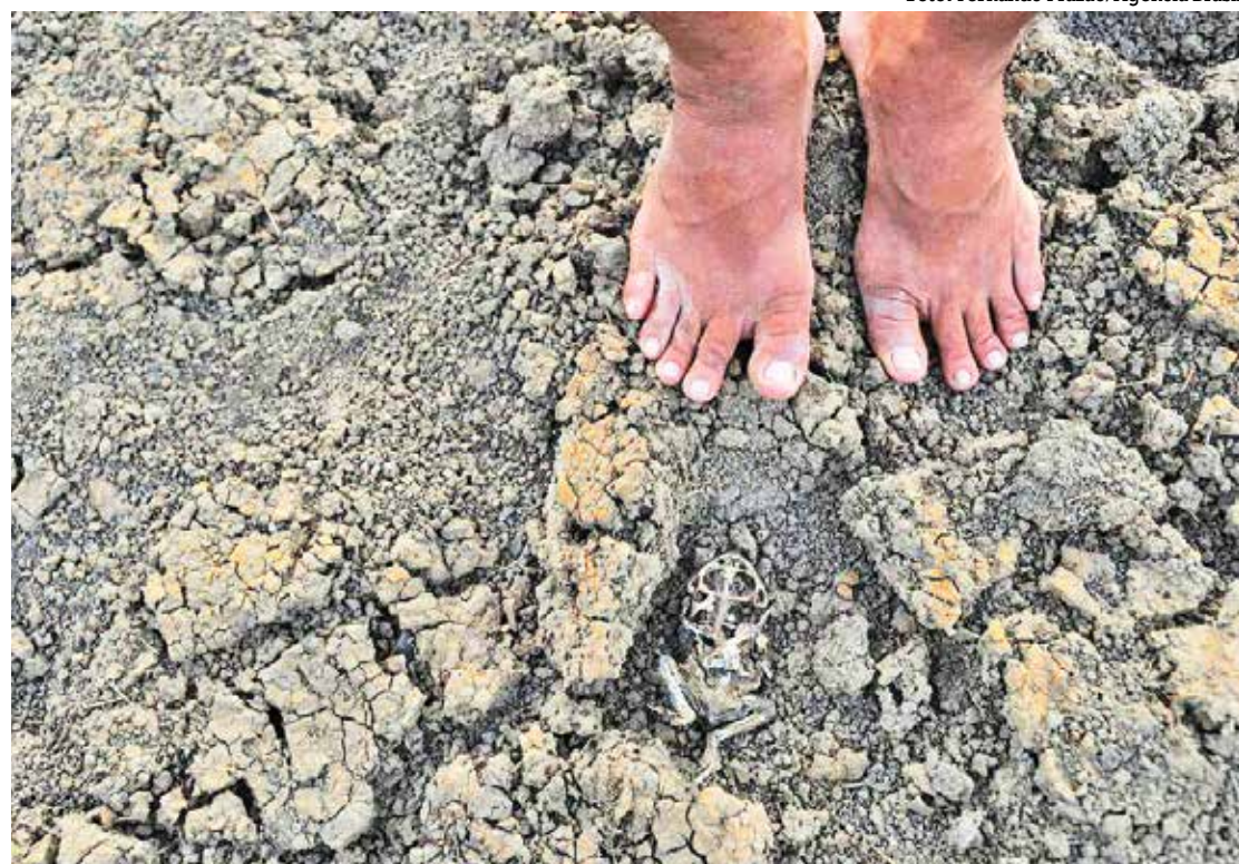
Dos 38 municípios listados no decreto, 19 pertencem ao estado do Rio Grande do Sul, que passa por um período de estiagem responsável por temperaturas recordes