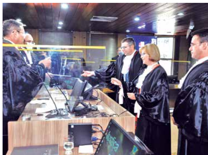
Desembargadora assumiu a vice-presidência e a corregedoria