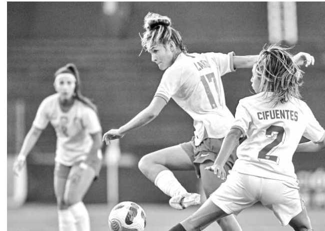
Meninas do Brasil golearam as chilenas por 8 a 0