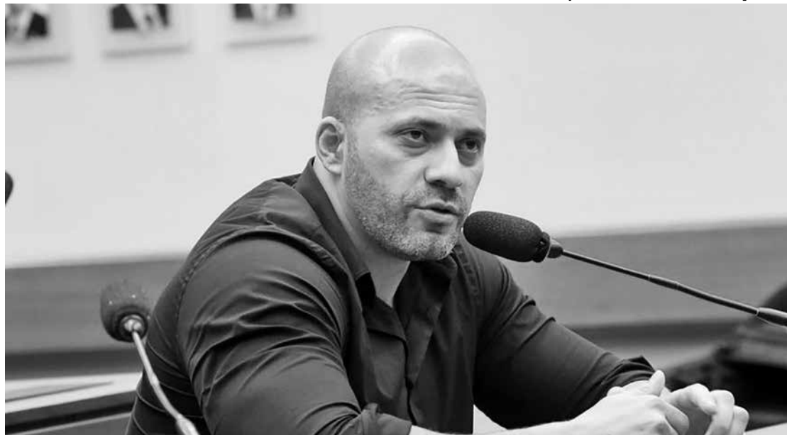
O deputado Daniel Silveira passou nove meses preso por fazer críticas aos ministros do STF