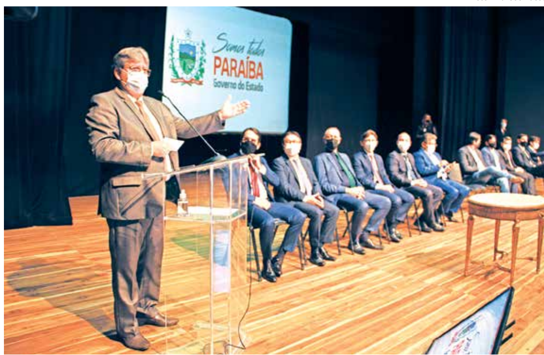
O governador presidiu a posse dos novos procuradores aprovados em concurso público estadual

O governador anunciou ainda que pretende realizar mais concursos em outras áreas para qualificar a prestação do serviço público na Paraíba e renovar os quadros de funcionários. O próximo certame a ser divulgado, segundo João Azevêdo é o da Agência Executiva de Gestão das