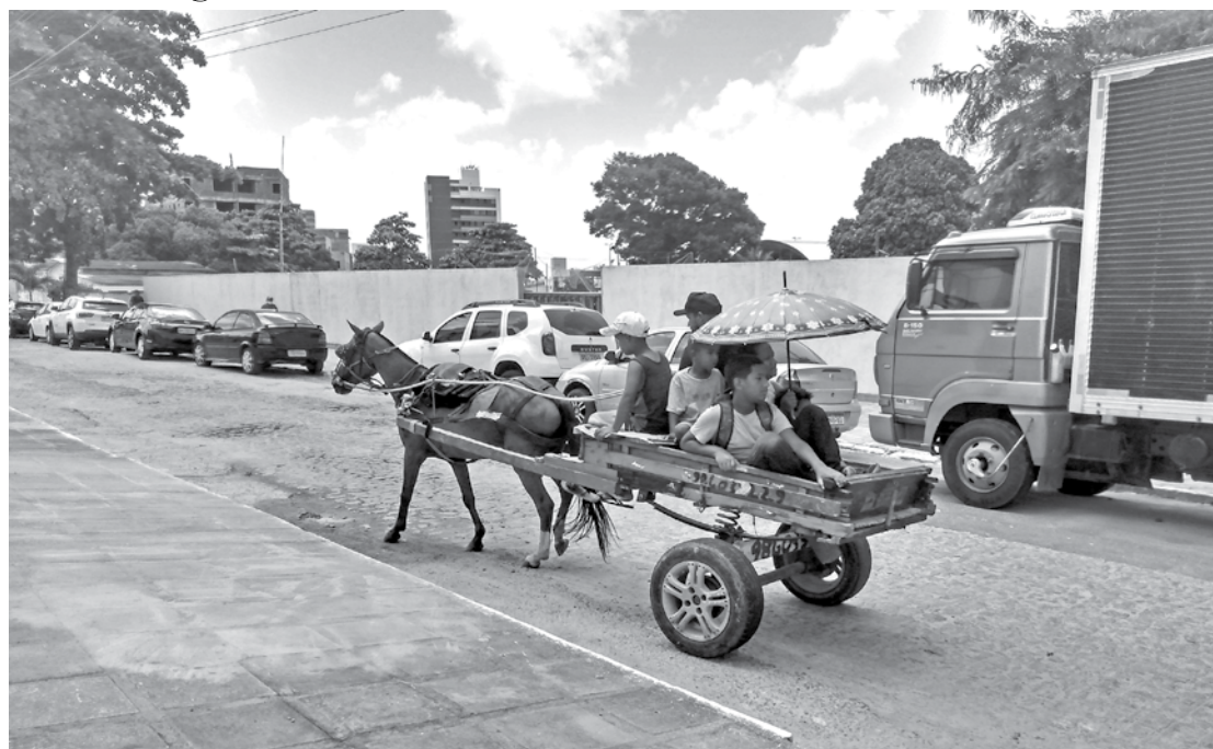
Enfrentando o calor